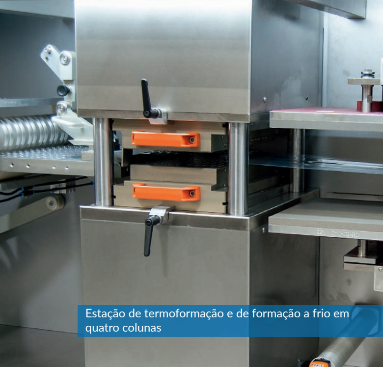
Estação de termoformação e de formação a frio em quatro colunas