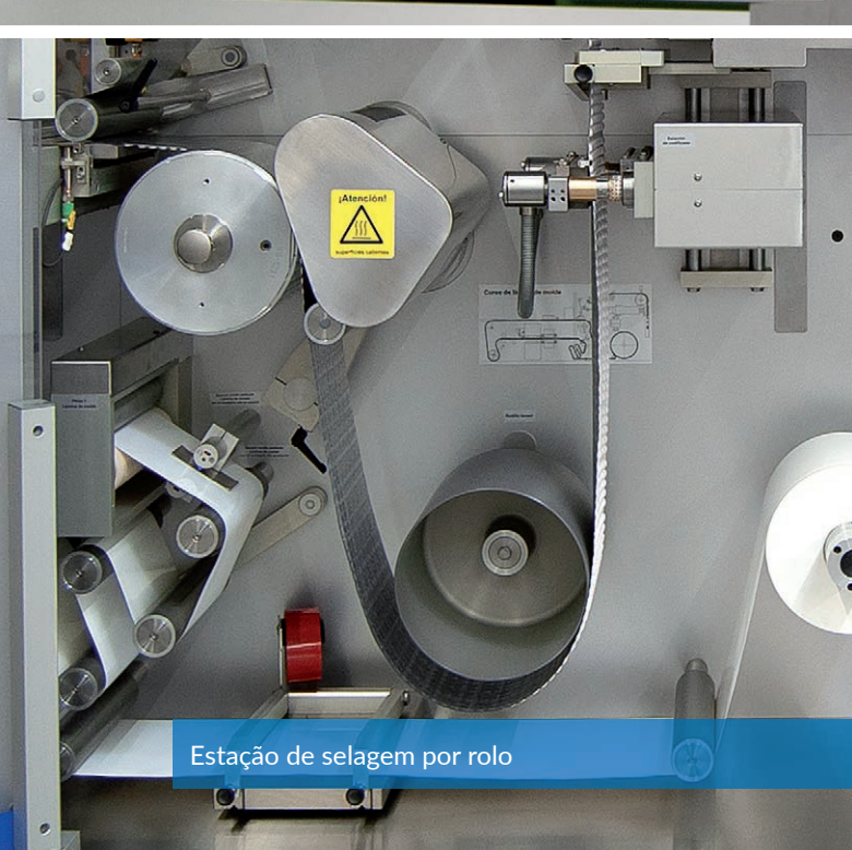
Estação de selagem por rolo