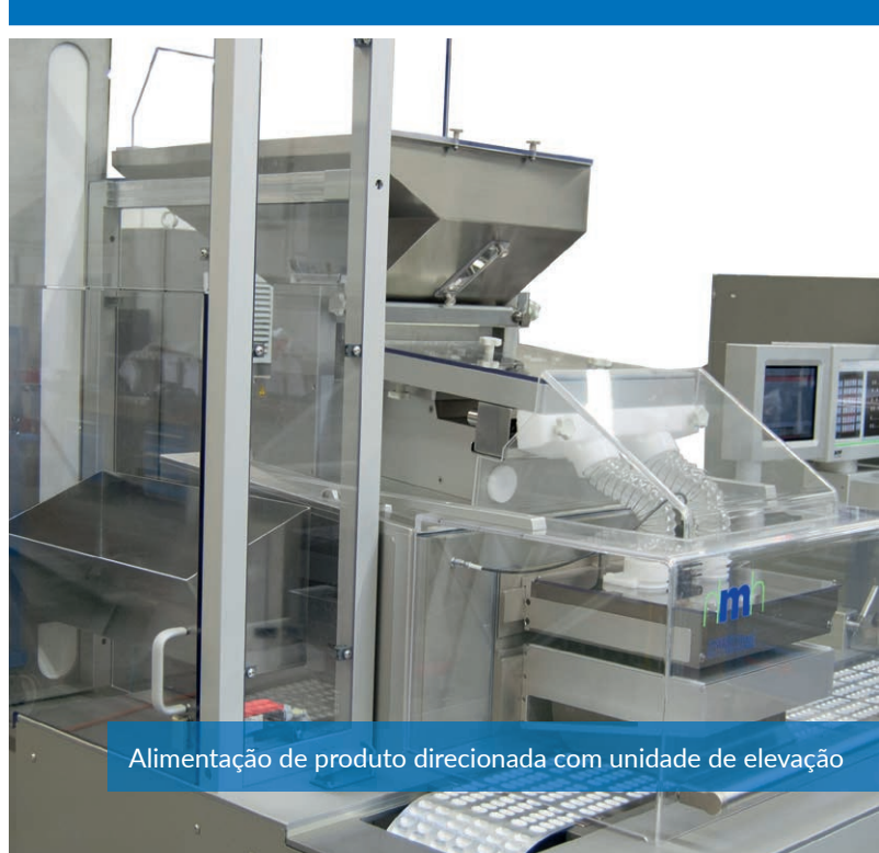
Alimentação de produto direcionada com unidade de elevação