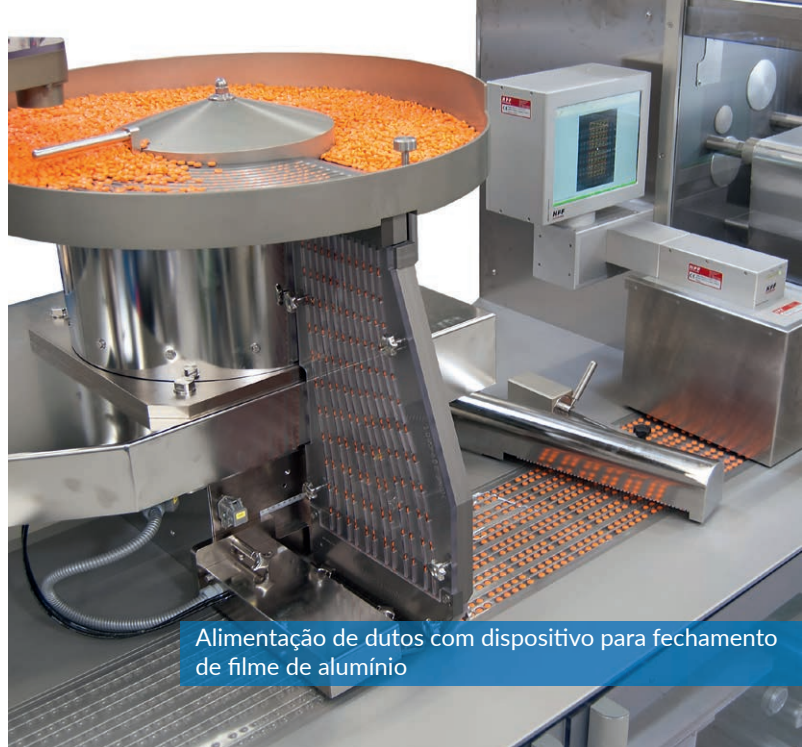
Alimentação de dutos com dispositivo para fechamento de filme de alumínio