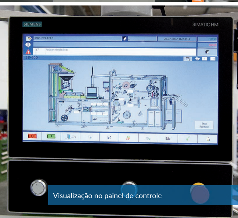
Visualização no painel de controle