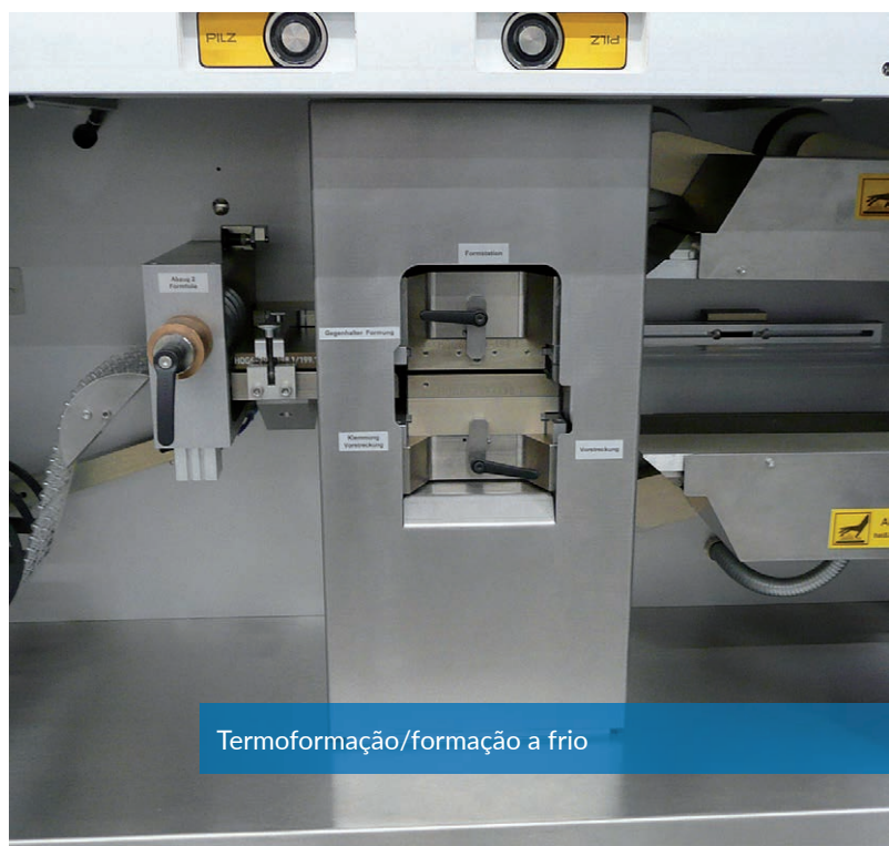
Termoformação/formação a frio