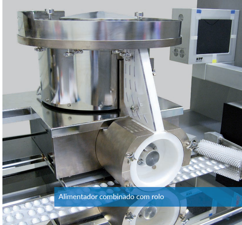
Alimentador combinado com rolo