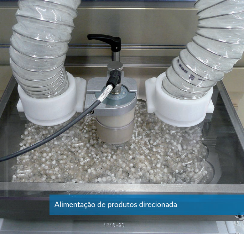
Alimentação de produtos direcionada