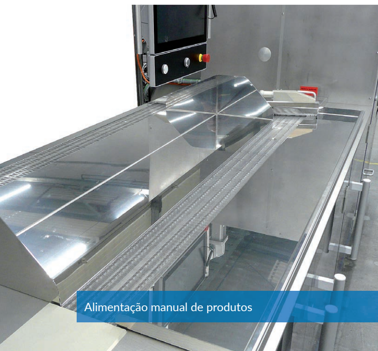
Alimentação manual de produtos