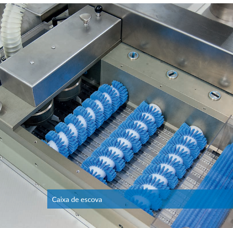
Caixa de escova